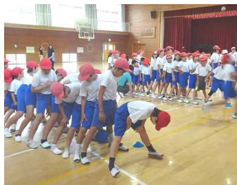
メデシングボール