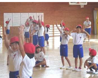
ウルトラマンシュワッチ