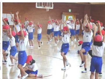
ドラえもんゲーム